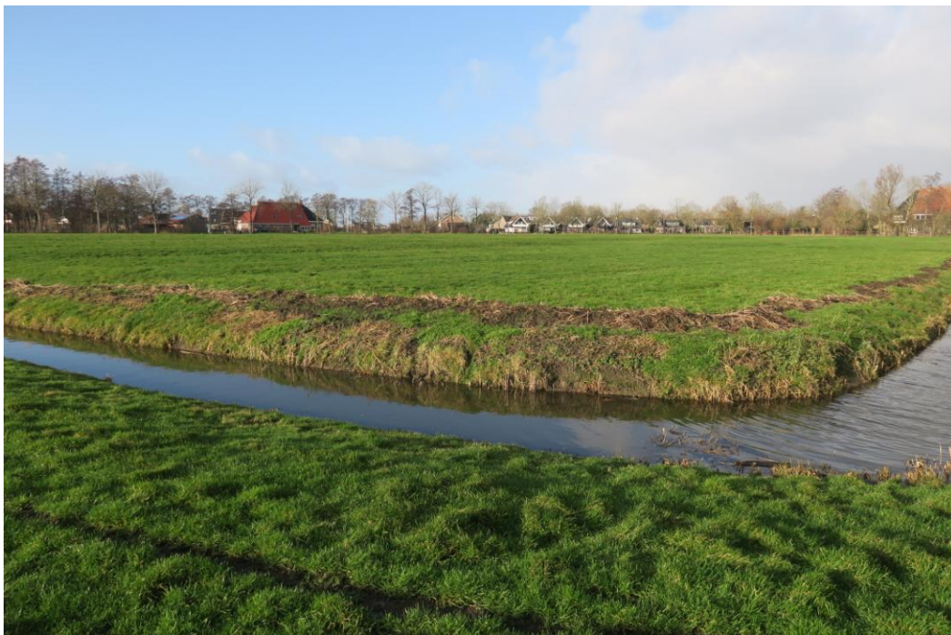
Foto's 1 en 2: impressie van het plangebied. Boven: vanaf de weg gezien, kijkend richting het noordoosten. Onder vanaf het plangebied gezien, kijkend richting het westen.